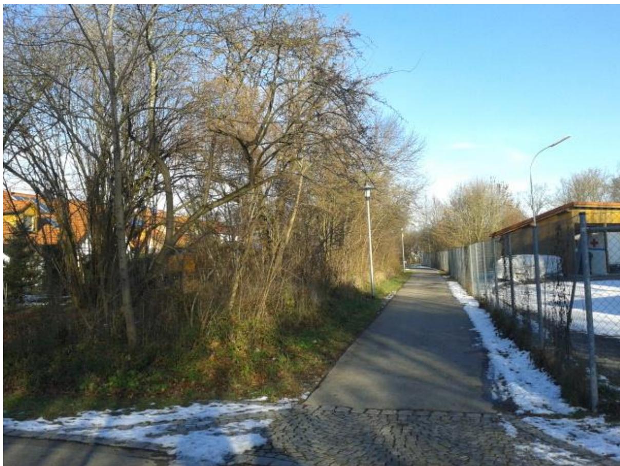
Abbildung 8: nördlicher Geh- und Radweg mit Grünstreifen

Insgesamt wäre jedoch eine Reduzierung des Grünflächenanteils innerhalb des Geltungsbereichs als weniger bedeutend einzustufen, da der erhaltenswerte Grünanger im Norden des Flurstücks die Funktion einer Frischluftschneise erfüllt und durch die vorhandenen, an den Weg angrenzenden, Grünflächen innerhalb des Geltungsbereichs keine quantitative oder qualitative Ergänzung darstellen.