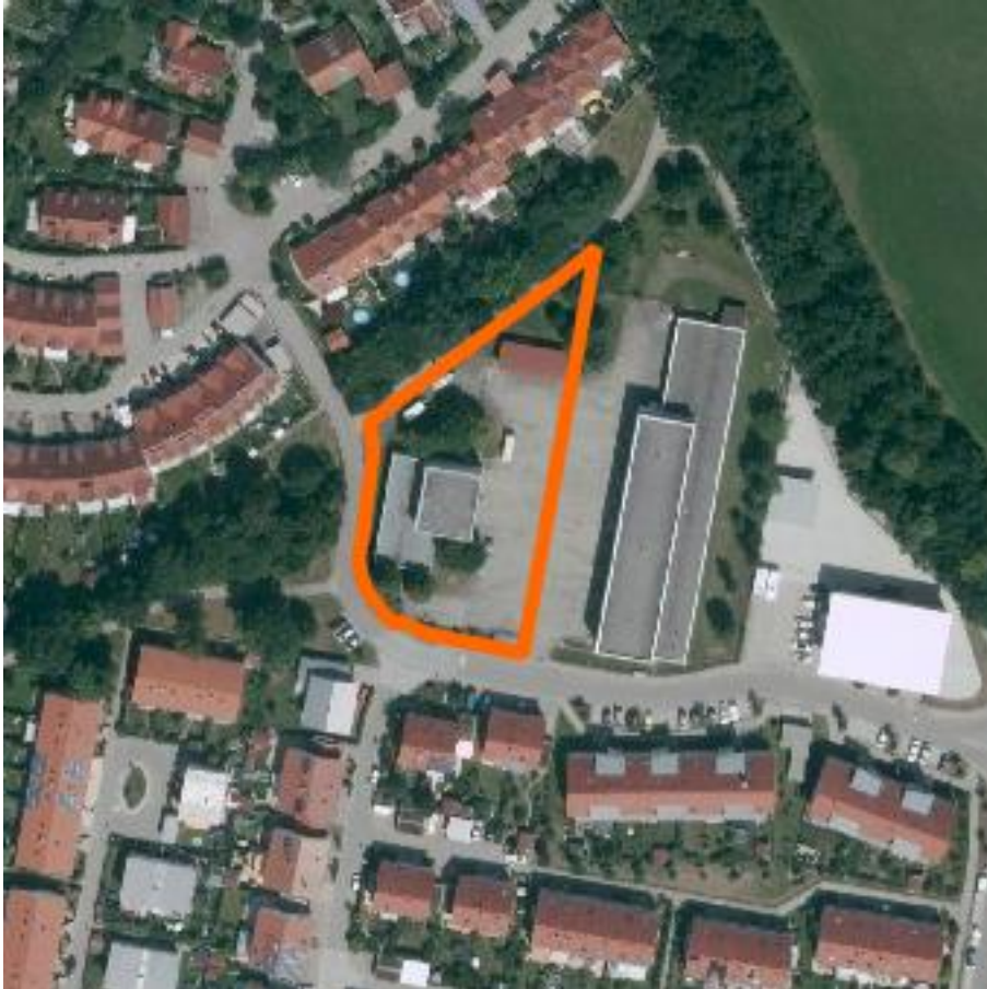
Abbildung 4: Luftbild mit Markierung der Lage im Stadtgebiet; Quelle: Geobasisdaten: © Bayerische Vermessungsverwaltung