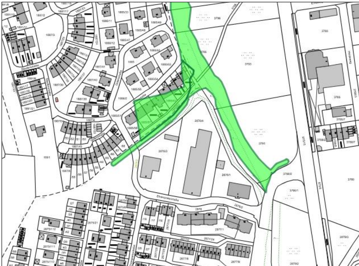
Abbildung 6: Biotopkartierung des Landesamts für Umwelt; Geobasisdaten: © Bayerische Vermessungsverwaltung