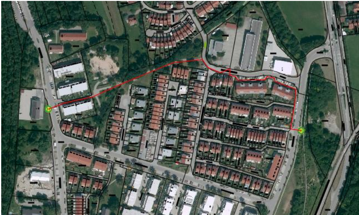
Abbildung 5: Luftbild mit Markierung der Haltestellen des Stadtbusses; Geobasisdaten: © Bayerische Vermessungsverwaltung