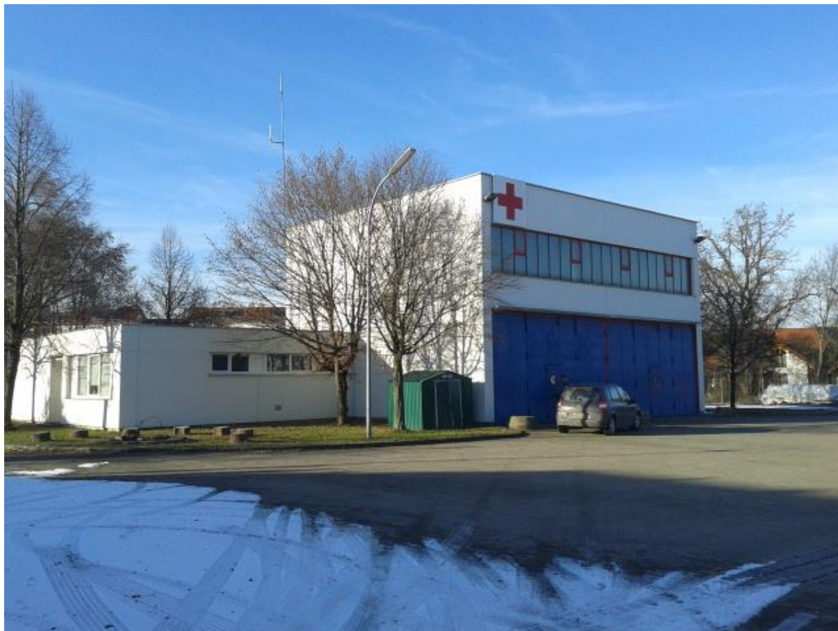
Abbildung 7: Bestandsgebäude BRK; eigene Aufnahme 03.12.2013

Die beschriebenen Nutzungen haben jedoch auch Auswirkungen auf die Umgebung des Geltungsbereichs. Da im Sinne des § 1 Abs. 6 Nr. 1 BauGB durch Bauleitplanung gesunde Wohn- und Arbeitsverhältnisse geschaffen werden sollen, ist maximaler Schutz für die direkte Wohnbauung im Süden und Norden des Geltungsbereichs zu gewährleisten.