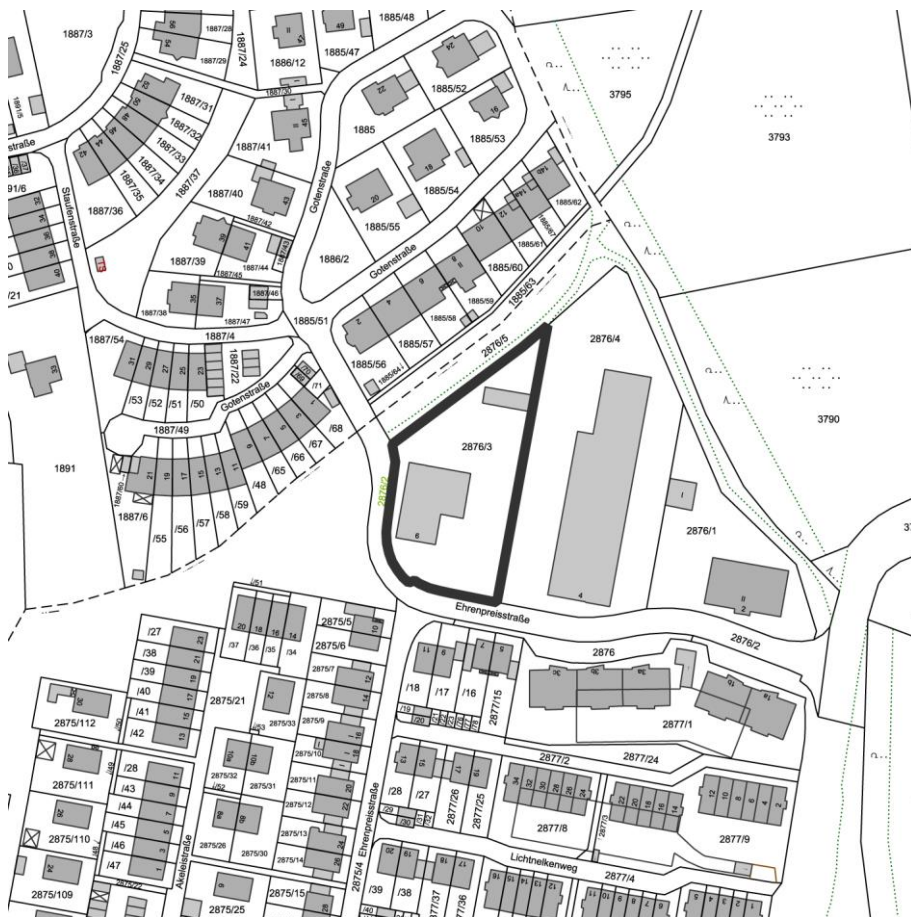
Abbildung 3: Digitale Flurkarte mit markiertem Geltungsbereich

Der Geltungsbereich liegt im südwestlichen Stadtgebiet von Landsberg am Lech. Südlich davon stellt das Baugebiet „Obere Wiesen“ den Stadtrand dar.